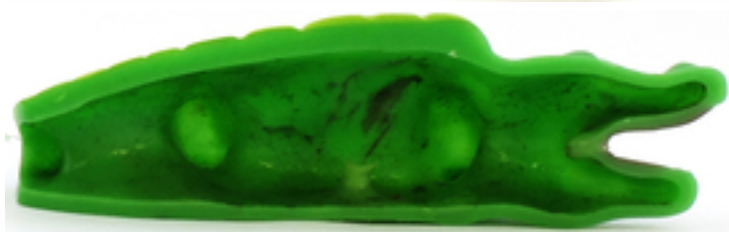
L'intérieur d'un crocodile et d'un canard de bain.