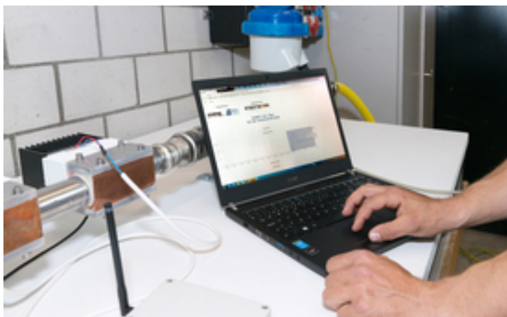
Mesure sans fil du débit dans le dispositif expérimental.