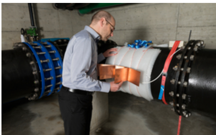
Ici, dans les services municipaux de Winterthour, on utilise les différences de températures – entre une conduite d'eau froide et l'air ambiant – pour produire l'énergie nécessaire au fonctionnement du capteur et à la transmission des données.