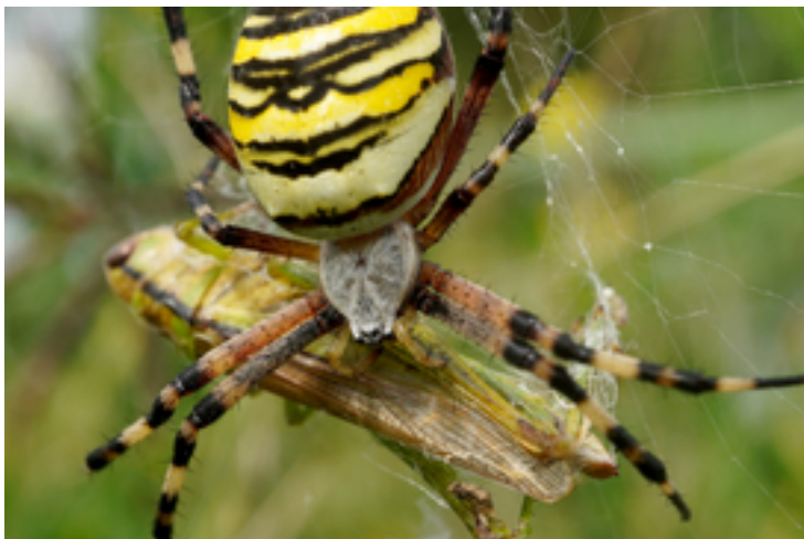
À gauche: Thomise brune ( Xysticus cristatus ) avec une abeille du genre Nomada (Photo: Maja Ili?) Au centre: Thomise brune ( Xysticus cristatus ) avec une coccinelle ( Coccinellidae ) (Photo: Maja Ili?) A droite: Épeire fasciée ( Argiope bruennichi ) avec sa proie (Photo: Maja Ili?)