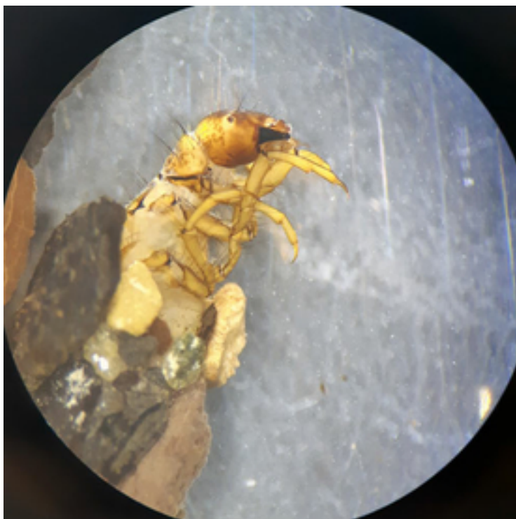
Rebecca Oester a répertorié sous le microscope le makrozoobenthos présent dans les échantillons des ruisseaux étudiés. Voici une larve de tricoptère.

Comme supposé, les différences dans la végétation du rivage ont aussi une incidence sur le taux de décomposition des feuilles mortes: sur les huit ruisseaux observés, les feuilles des échantillons provenant de sections boisées sont décomposées trois fois plus vite. «Nous n'avions pas compté avec une telle différence», déclare R. Oester. «Les êtres vivants se nourrissant de feuilles mortes étaient donc plus nombreux, mais probablement aussi plus actifs, dans les sections de ruisseaux boisées.»