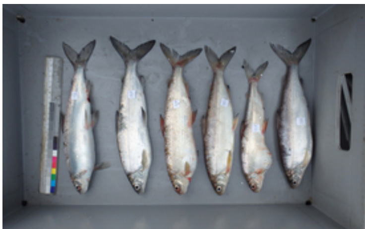
Corégones capturés de façon systématique dans le cadre du «Projet Lac».