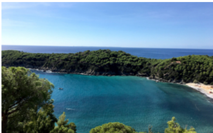
Une partie de la baie de Fetovaia, où la plupart des échantillons de l'étude ont été prélevés.

marin pour pouvoir survivre dans l'eau de mer pauvre en nutriments.» L'étude actuelle porte sur la posidonie de Méditerranée mais il est possible que le système ait également été adopté ailleurs. «Les analyses génétiques semblent indiquer que de telles symbioses existent aussi chez les herbes marines tropicales ou les salicornes, remarque Mohr. Ces associations permettent aux plantes à fleurs de coloniser les milieux les plus divers, même apparemment très pauvres, sur terre comme sous l'eau.»