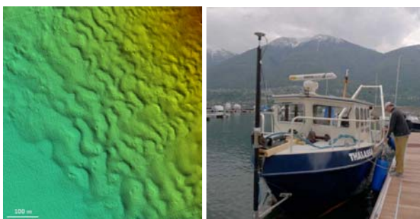
Die kleinen runden Trichter im Ticino-/Verzascadelta sind Zeichen von Gasaustritten. Rechts: Das Eawag-Forschungsschiff Thalassa im Hafen von Ascona.

Bilder in drucktauglicher Auflösung auf www.eawag.ch oder bei Andri Bryner, medien@eawag.ch ; Telefon: +41 (0)44 823 51 04